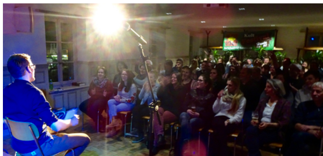
Wie kommt das Publikum wieder zurück? Symbolbild wier

Wier Seisler organisieren nun einen Weiterbildungsabend für Kulturorganisatoren, Mitglieder von Kulturkommissionen und sonstige Interessierte. Welche Veranstaltung bringt den Leuten etwas? Was erwartet die Bevölkerung überhaupt? Wie «verkauft» man einen Anlass in einer digitalen, schnelllebigen Welt?