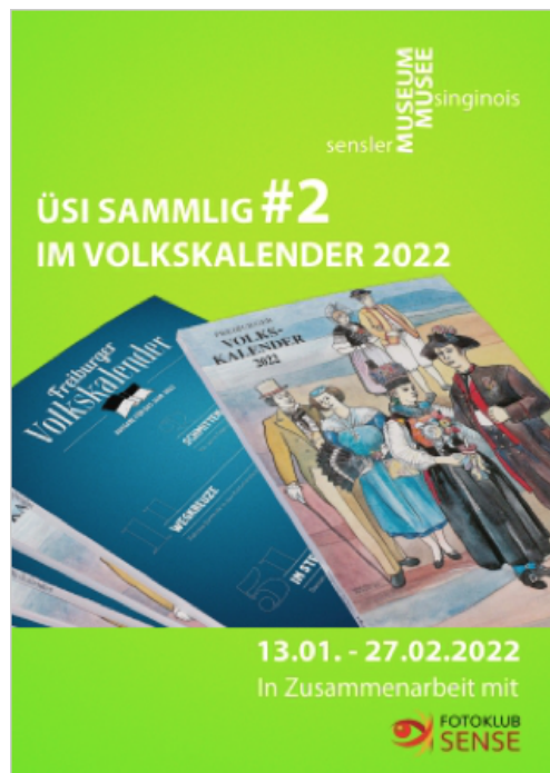
Die Bilder und Sammlungsobjekte der kleinen Winter-Wechselausstellung sind bis am 27.2.22 im Sigrischtehuus zu sehen.

#2 im Volkskalender» den Besuchern zu zeigen. Kunst aus Papier, Erinnerungsstücke von der Bad-Bonn-Chilbi, Bretzeleisen, Geschirr aus Plaffeien – unsere Sammlung ist ebenso vielfältig wie spannend. Beim Sammeln und Bewahren von Dingen und ihrer Geschichten geht es um Menschen und ihre Geschichten. Sie bleiben der Nachwelt erhalten. Mit unserer Vermittlung werden sie sichtbar und lesbar. Ein Artikel im Freiburger Volkskalender widmet sich dem 40. Geburtstag des Fotoklub Sense. Er stellt in dieser Ausstellung die Bilder aus, die im Volkskalender abgebildet sind und ergänzt sie mit weiteren Fotografien seines grossen kreativen Schaffens. Dominique Chappuis Waeber