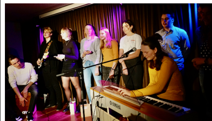
Abschlussong der Teilnehmenden im Jahr 2020.

kommt: Infos unbedingt weiterleiten. Zuschauer: Natürlich kann man auch einfach kommen und die Nachwuchs-Bühnenkünstlerinnen und -künstler unterstützen. Bewertung gibt es keine. as/chs Do. 10.2.22, 20 Uhr. Eintritt 10 Fr., ermässigt 8 Fr. Anmelden: Facebook-Gruppe «Nachwuchsabend Wier Seisler» oder aschwaller11@gmail.com. – Für Zuschauer: 026 494 53 13.