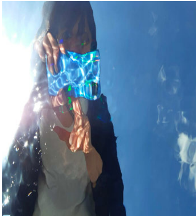
Der Beitrag von Catherine Liechti zum Thema «Nähe».

Die Wechselausstellung des 5. Sensler Kunstwettbewerbs zum Thema «Nähe» ist offen bis 7. November, öffentliche Vernissage am 17. September, 18 Uhr – Führungen am Do., 30. September, 19 Uhr und So., 17. Oktober, 14 Uhr. dew