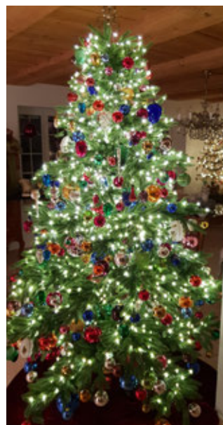
Bunt geschmückter Baum

Weihnachtsausstellung bis 6. Januar 2022, öffentliche Vernissage am 26. November, 18 Uhr – Führungen am Do., 2. Dezember, 19 Uhr und So., 19. Dezember, 14 Uhr.