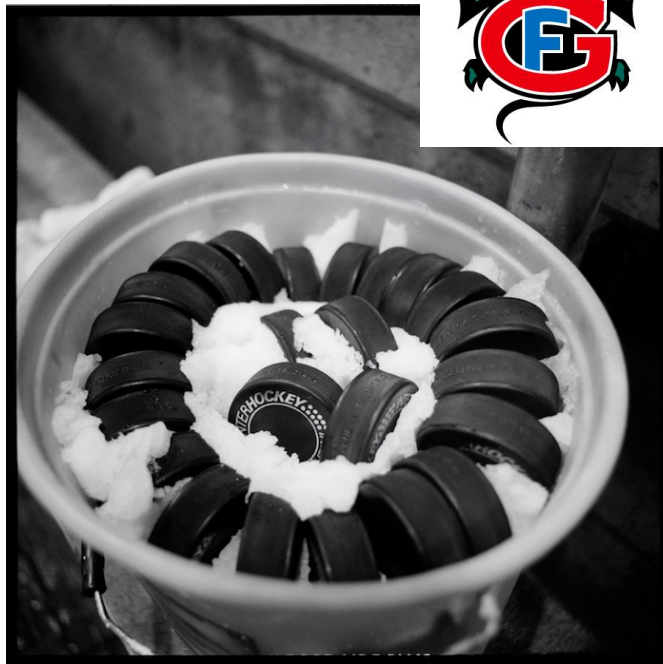
Im Hotel-Restaurant Taverna erwartet das Publikum am 30. April ein prallvoller Kessel Eishockey.