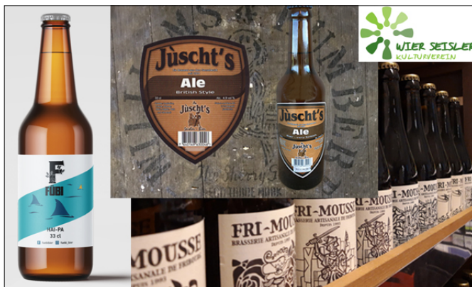
Mit dabei unter anderem: Fubi, Jusch's und Fri-Mousse.

Die zweite Bierdegustation läuft beim Petanque-Platz (zwischen der alten Käserei und dem Pflegeheim St. Martin), von 17 bis 21 Uhr. Um ca. 18.30 Uhr gibts öffentliche Infos zu den Bieren. Mit einem Degu-Glas für 20 Fr. lassen sich alle Gebräue einfach probieren. Es gibt auch Grilliertes und alkoholfreie Getränke. Keine Anmeldung nötig. chs/ak