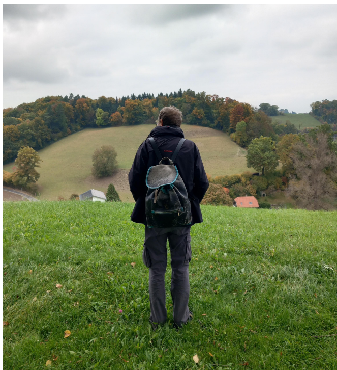
Von Schmitten nach Basel und nun wieder zurück im Senseland – für eine Ausstellung und seine Arbeit in der Residenz.

Die aufwendige Arbeit an Modellen hält Rappo nie von seiner